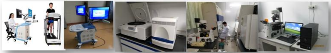
关节三维步态分析平台